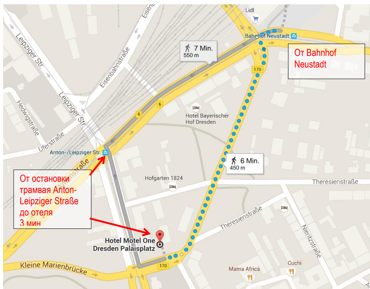
Схема прохода от вокзала Bahnhof Neustadt до отеля Motel One:

Нужно доехать на электричке до остановки Bahnhof Neustadt, ехать 13 минут. Оттуда можно дойти либо пешком 6 минут, или проехать на трамвае № 6 или 11 одну остановку до Anton-/Leipziger Straße.